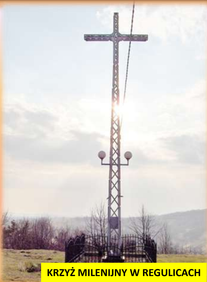
KRZYŻ MILENIJNY W REGULICACH

Przez Alwernię prowadzą dwa międzynarodowe szlaki rowerowe: Kraków–Morawy-Wiedeń Greenways i Eurovelo R4, które łączą się z pętlami lokalnych tras rowerowych.