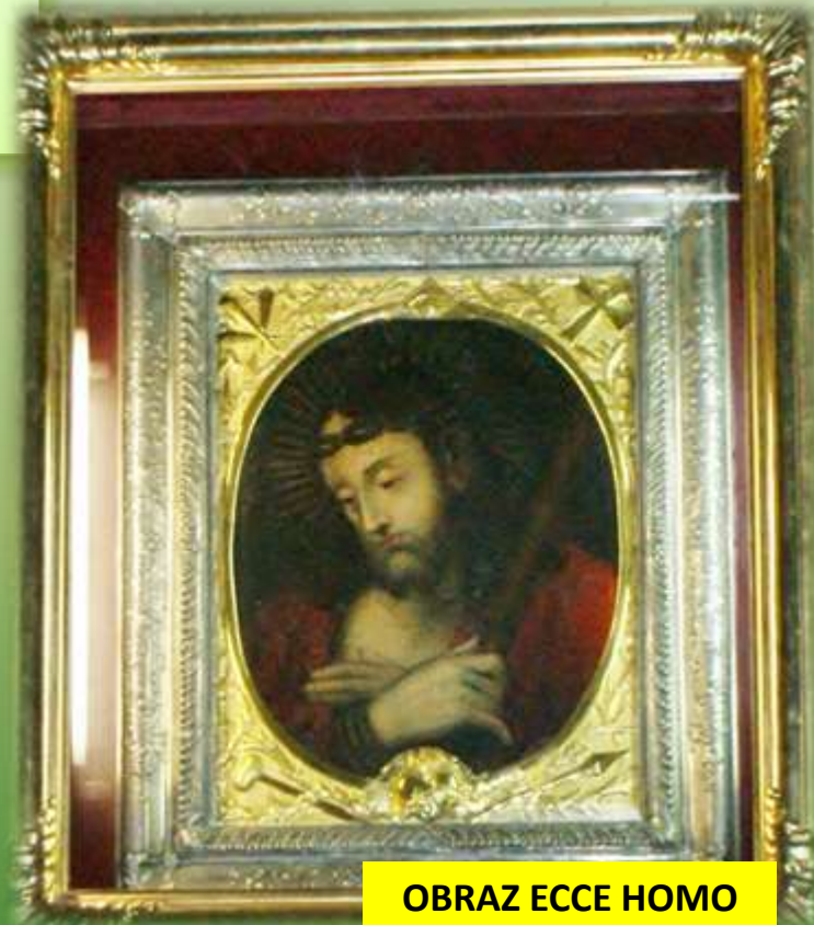
OBRAZ ECCE HOMO

Ciekawymi obiektami zabytkowymi są rzeźby z XVII w. oraz organy i ambona z II połowy XVIII wieku