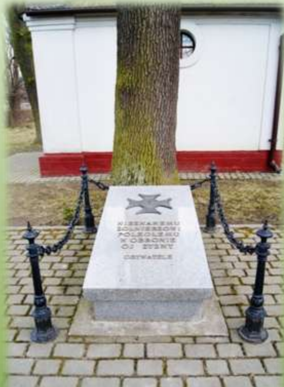
GRÓB NIEZNANEGO ŻOŁNIERZA