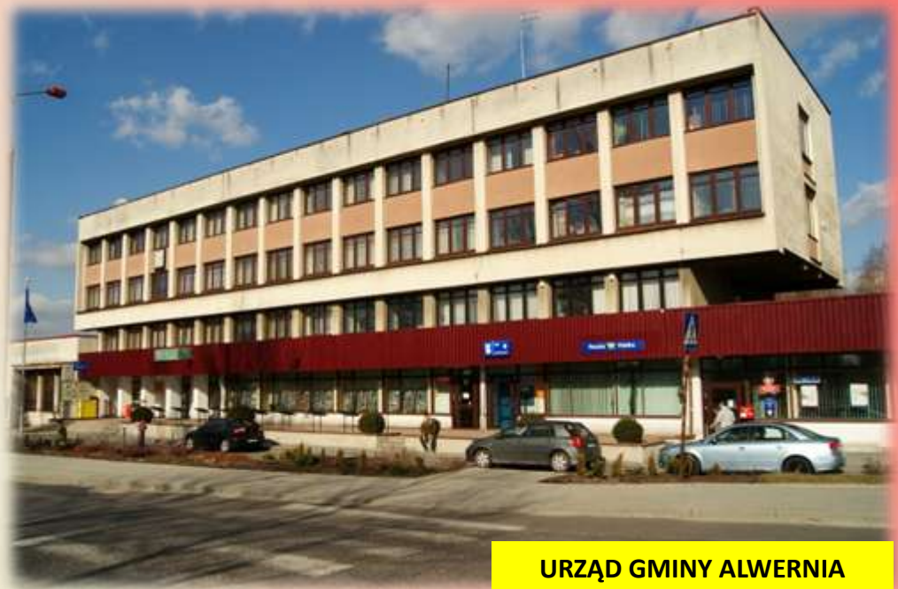
URZĄD GMINY ALWERNIA

Powierzchnia gminy: 75,27 km 2 Liczba ludności: ponad 12,5 tys.