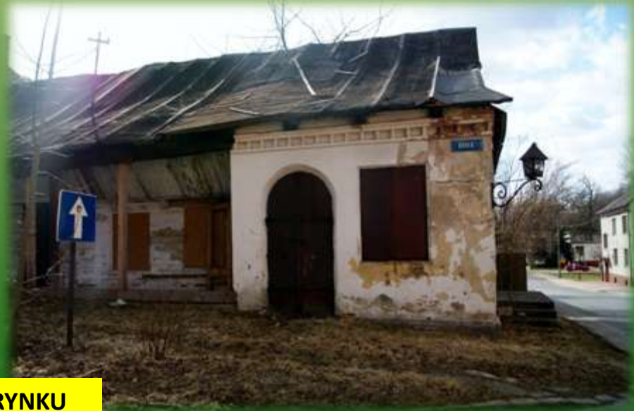
STARA ZABUDOWA RYNKU