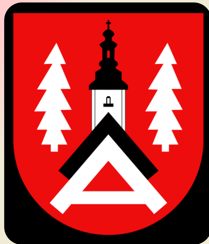
HERB GMINY ALWERNIA